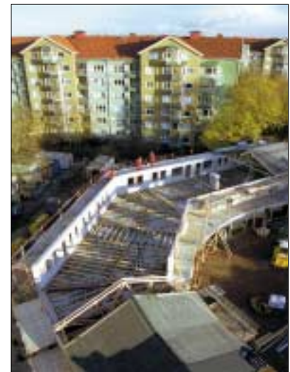
Bygget uppifrån där man kan se en bit av oktagonen och gröna tak.

Är du intresserad av en lägenhet i huset? Kontakta Maj-Lis Olsson på tel. 040-31 36 04.