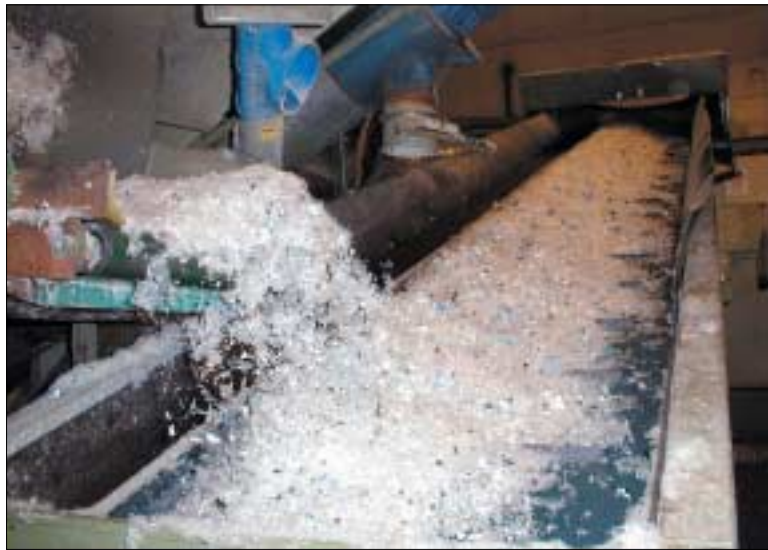
Sönderriven plast som sedan blandas med vatten och blir till pellets som på bilden till vänster.