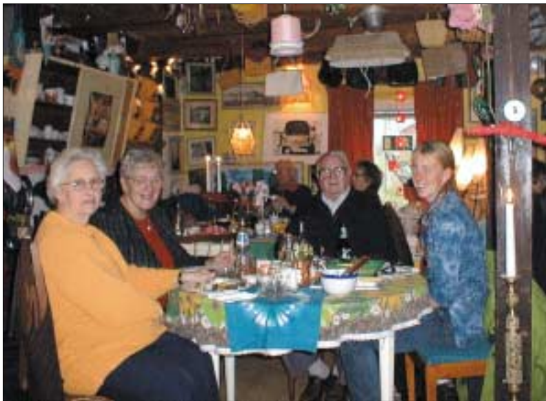
Lunch på den lite annorlunda och hemtrevliga restaurangen Elofs skafferi i Billeberga.

Den 21 november åkte 34 boende från Augustenborg på en studieresa med temat "Vart tar förpackningarna vägen?". Bussresan började med ett besök på Spillepengsområdet och Sysav där vi guidades runt i den egna bussen. Intrycket av anläggningen var att den nog står i så god samklang med naturen som det är möjligt med dagens teknik, men då man ser vidden av vårt sopsamhälle så finns det