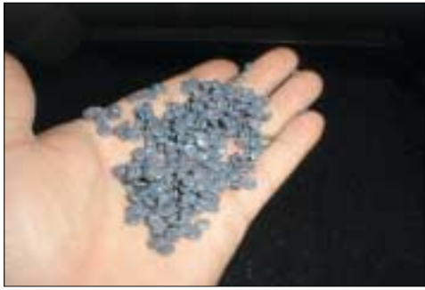
Plastpellets återvunna från plastsäckar på väg att bli nya plastsäckar.