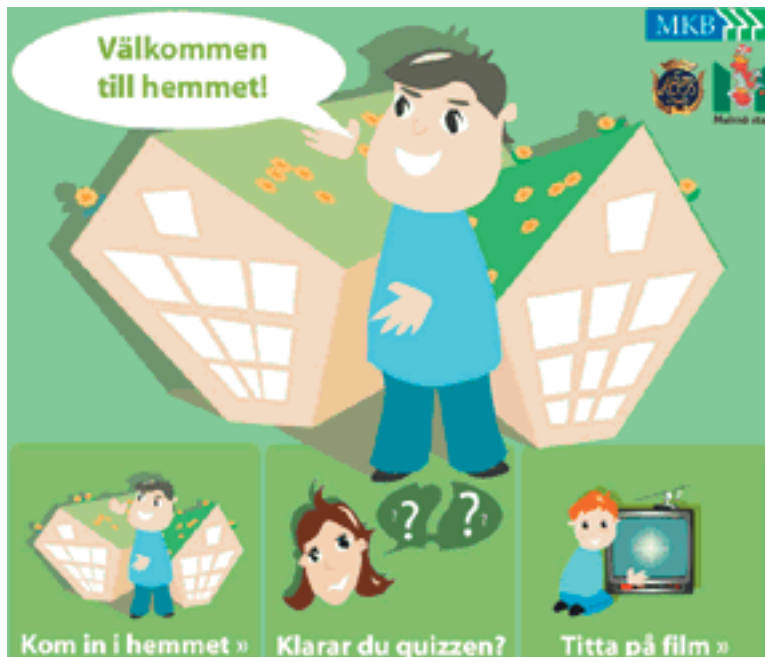
Interaktiva www.ekostaden.com/hemmet ger vardagliga miljötips