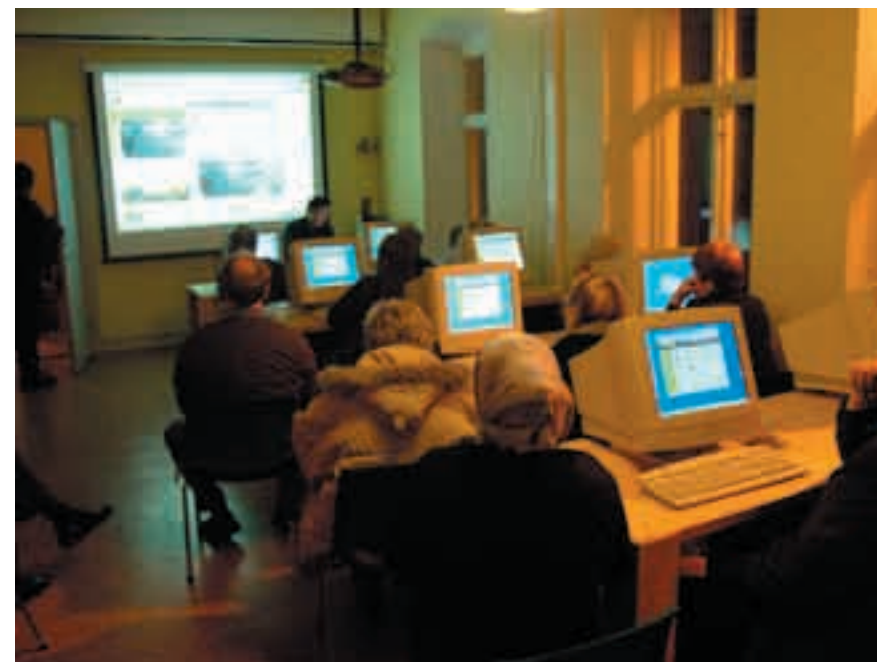
Informationsmöten för boende i Augustenborg