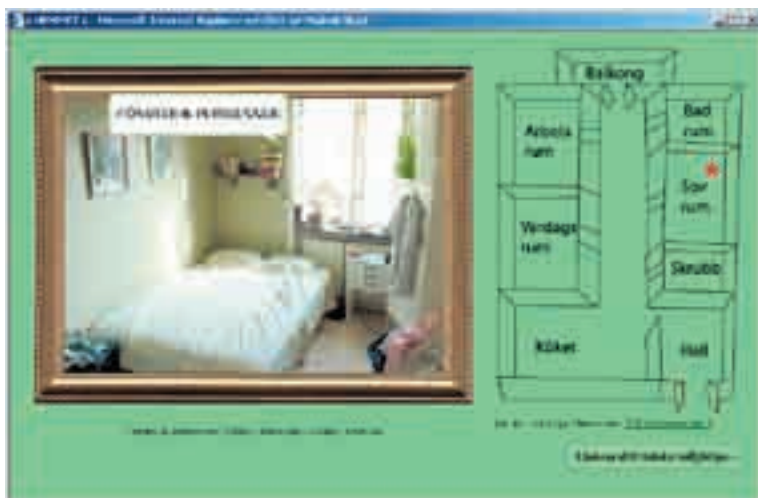
En titt i sovrummet ger bland annat tips om att sänka temperaturen på elementet om fönstret ska stå öppet under natten