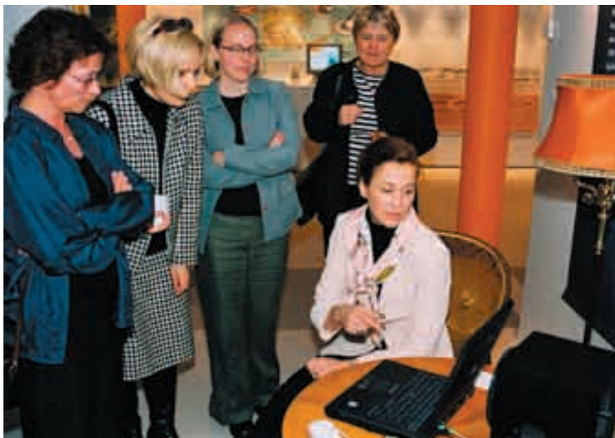
Webbfilm visas upp för intresserade