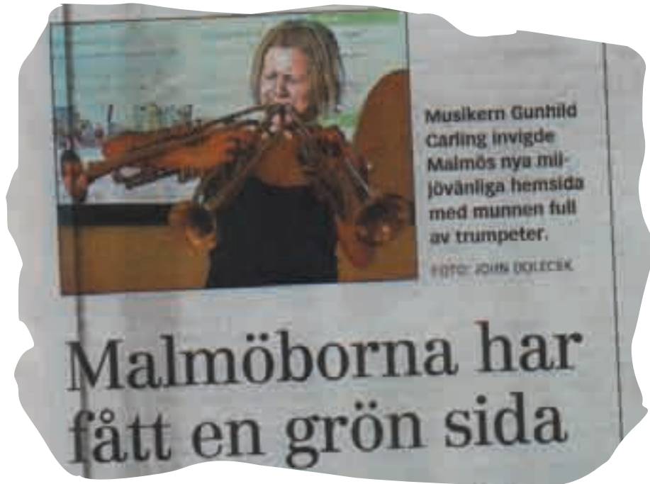
Med trippel trumpetfanfar lanserades Ekostaden.com