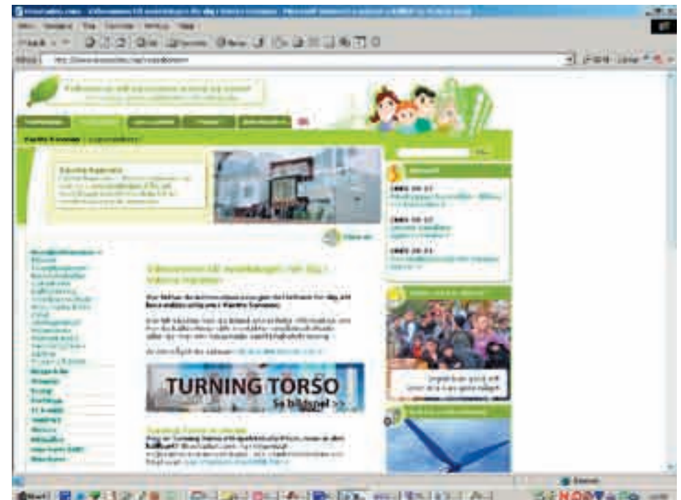
Ekostaden.com har särskilda boendeinformationssidor för Västra hamnen

Dessutom har uppmärksammade specialåtgärder gjorts som föreläsningar, gröna marknader och ett interaktivt miljöanpassat hem på nätet. Hemsidan Ekostaden.com har ungefär 250 besökare om dagen.